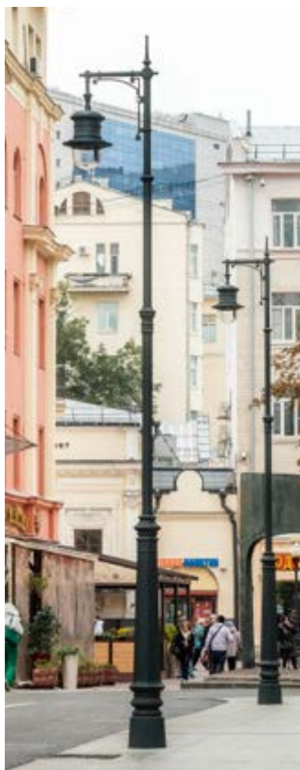
Арбатские переулки. Москва

Рекомендуемый фундамент: ФМ 0,159-2,0 Ø 340 мм