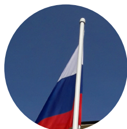
■ Флаг РФ (по запросу)