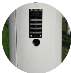
■ Встроенная ручная лебедка со съемной ручкой