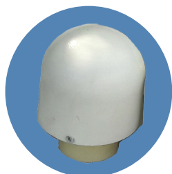
■ Поворотное наверху

Флагштоки (ФКК) 6 / 9 / 10 / 12 метров со встроенной лебедкой