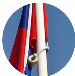
■ Оттяжка флаж-ного полотна