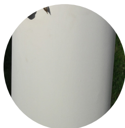
■ Круглоконическая опора окрашенная